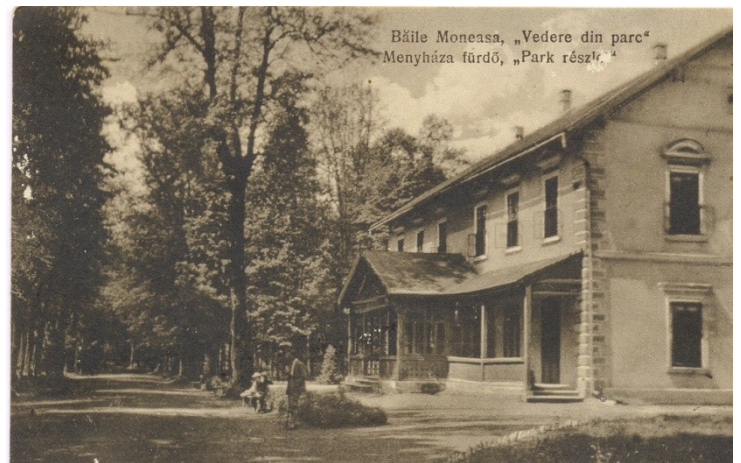
Hotel Central (sus), azi Vila Cerbul Albastru (jos)