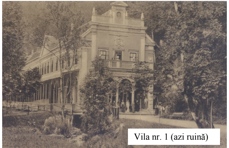
Vila nr. 1 (azi ruină)

În perioada 1956 -1968, când Moneasa aparținea de Regiunea Crișana, este modernizată infrastructura stațiunii, ea devenind astfel, începând cu 1961, o stațiune permanentă. Începând cu 1971 stațiunea Moneasa a fost preluată de Ministerul Turismului, care, datorită creșterii numărului de turiști și a cerințelor tot mai diversificate din partea acestora, finanțează construirea unor hoteluri și baze de tratament moderne (Parc în 1976, Moneasa în 1984). În 1986 se finalizează construcția Hotelului Codru Moma, existând astfel o capacitate de 550 de locuri de cazare.