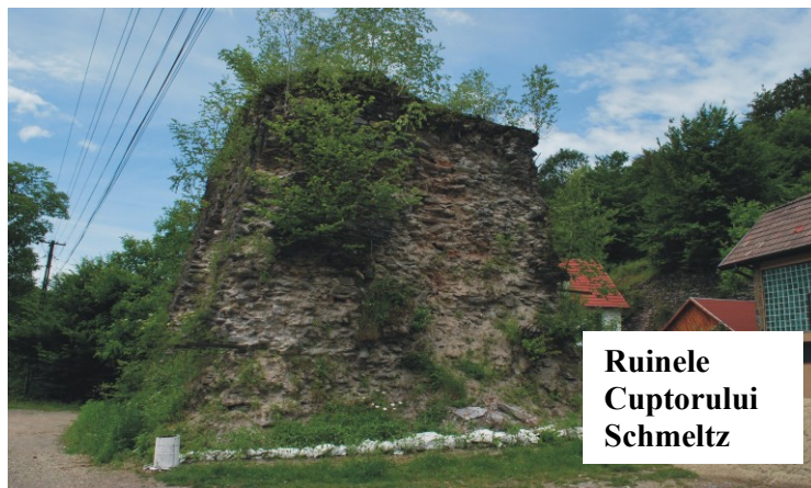
Ruinele Cuptorului Schmeltz